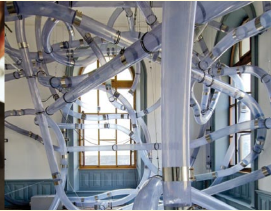
Bilder v.l.n.r.: Earthrace, Annual Cansat Competition, SOM, Interact, Kunsthalle Bern